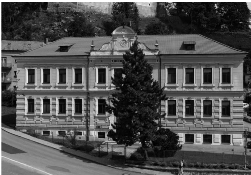
Budova školy v letech 1960 a 2011.