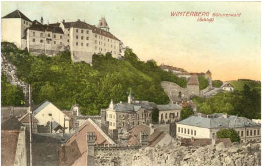
Nejstarší budova budoucí obchodní akademie a gymnázia na dobových pohlednicích Vimperka (1898, 1910).