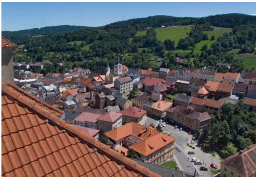
Celý komplex budov dnešního G a SOŠe pohledem ze zámecké Vlčkovy věže.