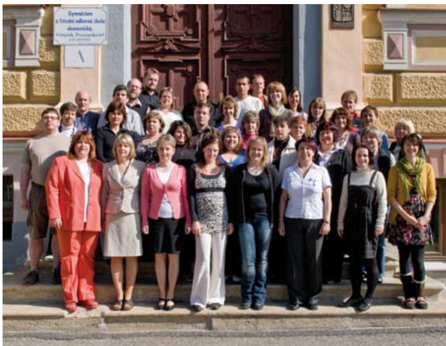
Pedagogický sbor ve školním roce 2010/11.