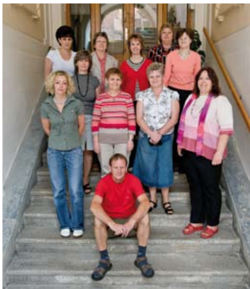
Provozní zaměstnanci školy ve školním roce 2010/11.