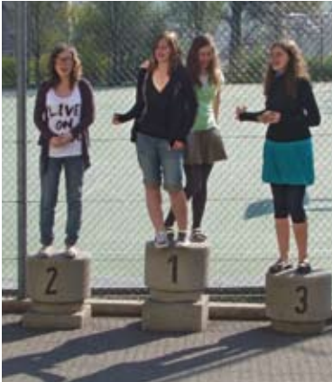
Nácvik soutěžního zpívání na stupních vítězů.