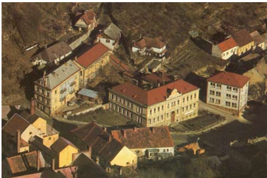
Letecký snímek z roku 1976 zachycuje čerstvě postavenou budovu „B“.