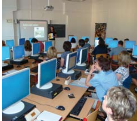
Bez výpočetní techniky si dnešní chod školy neumíme ani představit.