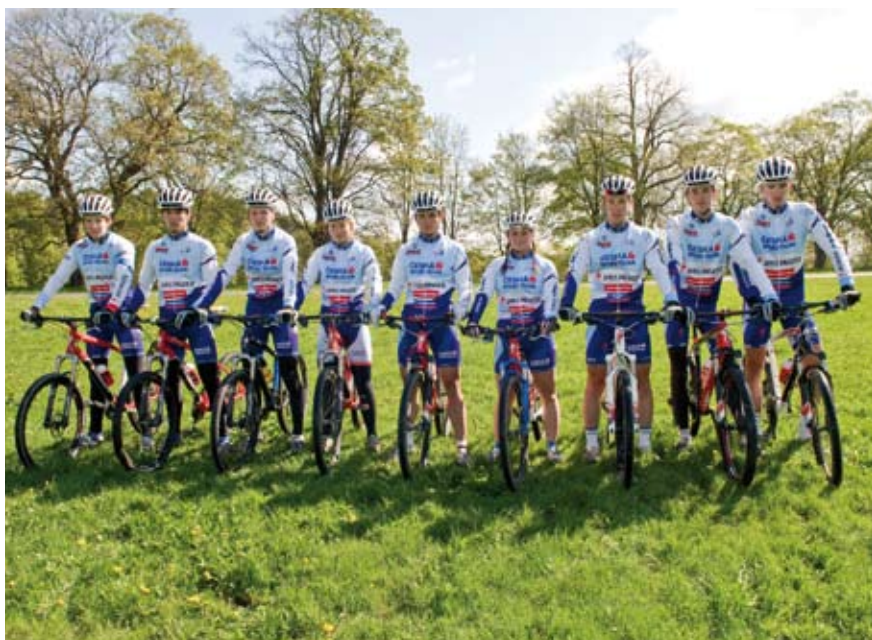
Družstva běžců na lyžích a cyklistů.